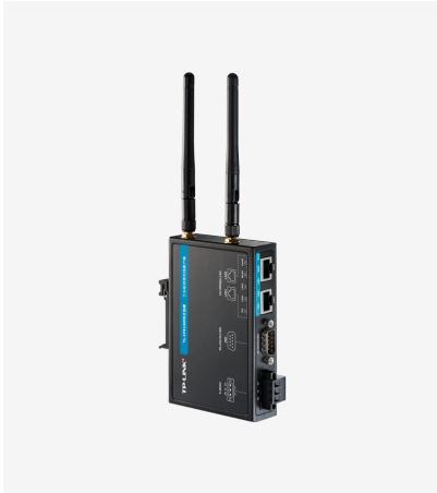
工业级双频无线客户端 TL-CPE1300D工业级