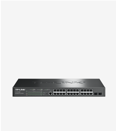
全千兆网管PoE交换机 TL-SG3226P