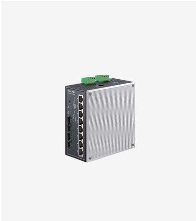
环网三层网管工业交换机 TL-SG5412工业级